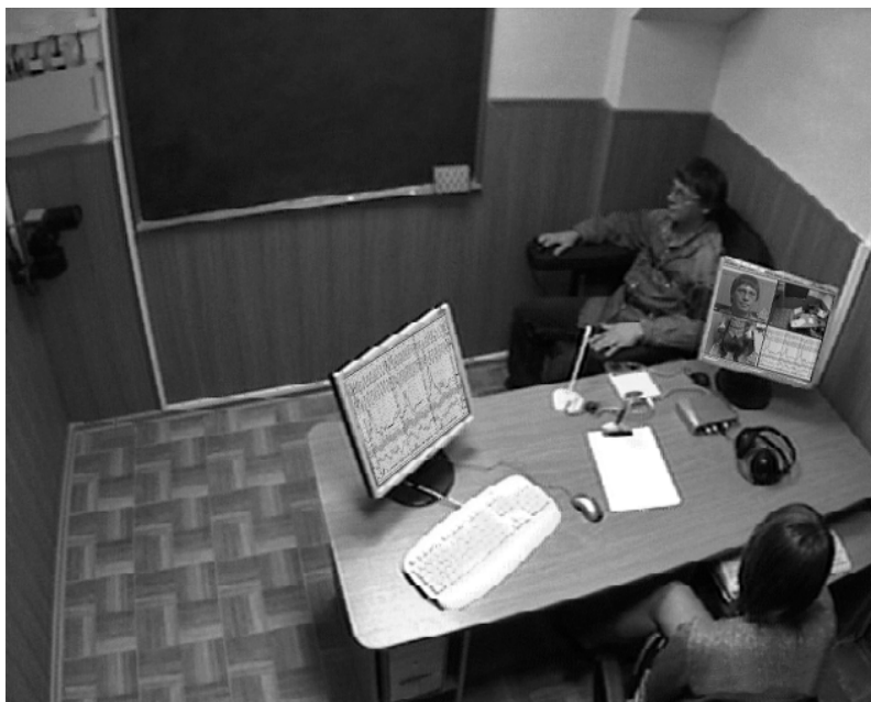
Рис. 2. Фрагмент тестирования на полиграфе с применением видеоконкомплекса «Диана-видео»

На рис. 2 показан фрагмент процедуры тестирования на полиграфе с использованием видеоконкомплекса «Диана-видео».