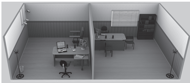
Рис. 1. Схема компоновки видеокomплекса «Диана-видео»

На рис. 1 показана схема компоновки комплекса «Диана-видео», размещенного в двух помещениях: базовом и операторском.